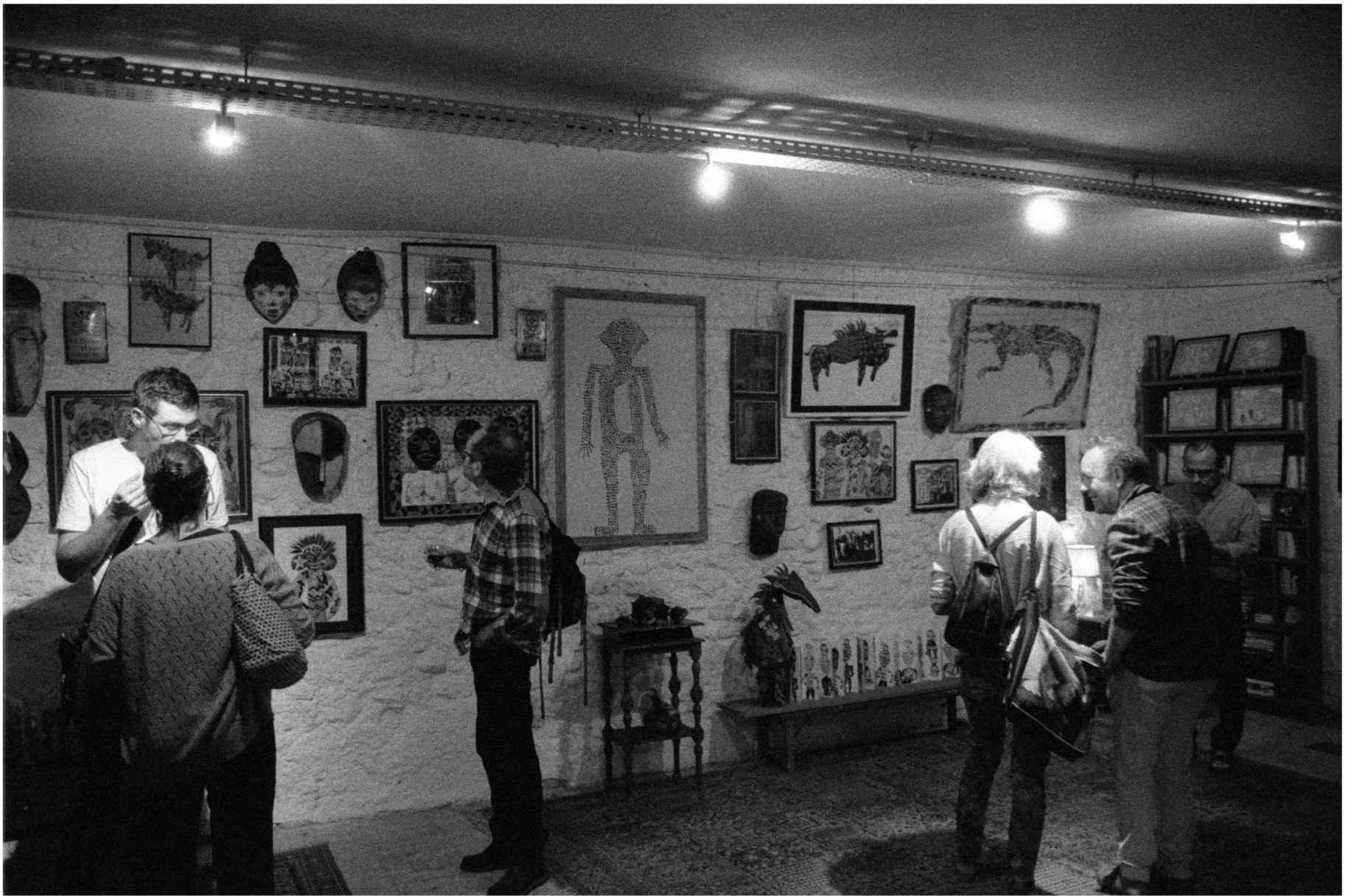
Septembre 2023 Galerie l'Etranger